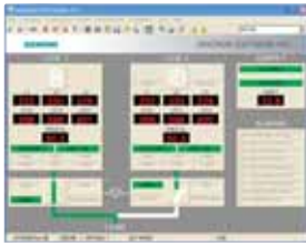
SENTRON SOFTWARE ATC