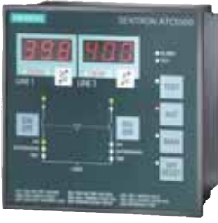
SENTRON ATC 5300