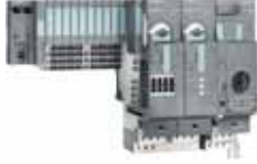
ET200S Motor Yolvericiler