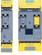
3SK2 Ana Modül