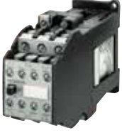
3TF40 ve 3TF41