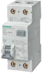
5SU13... 5SU16... 5SU67...